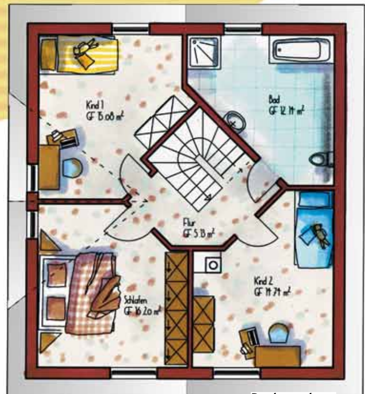
Dachgeschoss Maßstab 1:100

Bickel-Massivhaus GmbH Hohe Straße 200 35745 Herborn-Seelbach Tel. 02772 / 96 56-0 Fax 02772 / 96 56 96 eMail: info@bickelbau.de