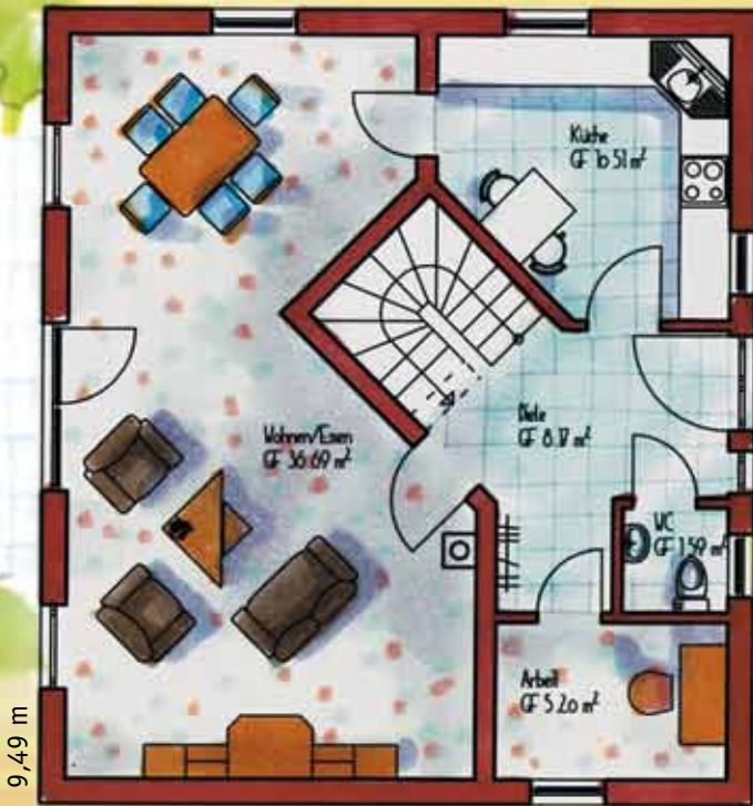
Erdgeschoss Maßstab 1:100